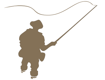
Tratto pesca a mosca