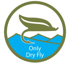
Solo mosca secca